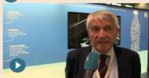
11 novembre 2016 Green economy, Montello Spa: da crisi siderurgica a rinascita

C arta, vetro, metalli e plastica, se correttamente raccolti e selezionati, permettono oggi un risparmio di 6 miliardi e mezzo sulle importazioni di materie prime dall'estero. E nel sistema delle materie prime seconde (mps), l'Italia risparmia già oggi 2 miliardi di energia, ovvero il 10% dei consumi elettrici. Lo dice il Was (Waste Strategy) Annual Report 2016, coordinato da Althesys, che racconta quanto vale l'economia circolare per il nostro Paese.