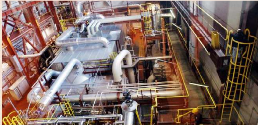
Impianto di termovalorizzazione