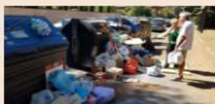
Cassonetti sommersi dai rifiuti

lo sviluppo dell'industria del riciclo ha fatto crescere i mercati delle mps. Solo nel comparto della carta, ad esempio, negli ultimi 15 anni la carta recuperata è quasi raddoppiata passando dal 26% del 2000 al 47% del 2015. Questo ha permesso all'Italia di diventare esportatrice netta di maceri, ribaltando la posizione storica di dipendenza dall'estero.