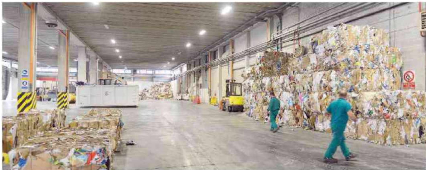
L'impianto dell'Amiu di Genova dove carta e cartone vengono recuperati e riciclati