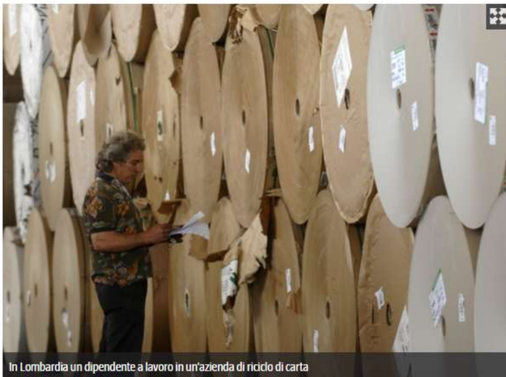
In Lombardia un dipendente a lavoro in un'azienda di riciclo di carta

Nei bidoni della spazzatura del nostro Paese c'è un vero e proprio tesoro. Carta, vetro, metalli, plastica, la stessa frazione umida, correttamente raccolti e selezionati, consentono all'Italia di risparmiare 6,5 miliardi di euro sull'importazione di materie prime dall'estero. In più, grazie agli scarti di lavorazione delle materie prime oppure ai materiali derivati dal recupero e dal riciclaggio dei rifiuti (materie prime seconde) si evita di spendere due miliardi di euro in energia. Più o meno il 10 per cento dei consumi elettrici.