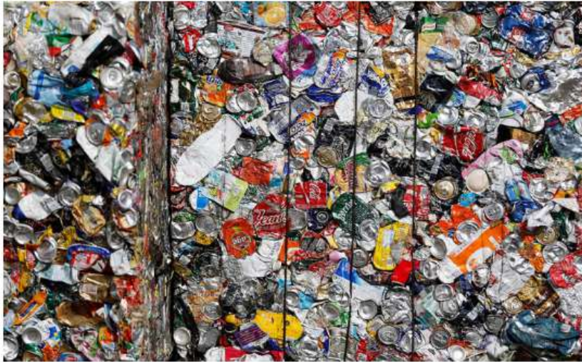
Una catena di riciclo rifiuti

Secondo il Was Annual Report 2016, l'Italia potrebbe risparmiare una cifra notevole sulle importazioni di materie prime dall'estero, se riuscisse a riciclarle in casa