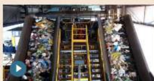
09 novembre 2016 Rifiuti, le nuove frontiere del riciclo della plastica

il 45% a legno e vetro. Infine il 46% opera solo nel business degli urbani, il 33% esclusivamente degli speciali, il 21% su entrambi i flussi.